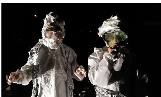
Im Mittelstufentreff werden «Smileys» zu Aliens ;)